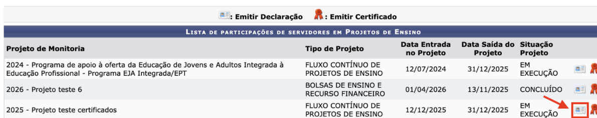
Imagem 3 - Emitir declaração de participação como membro da equipe de execução em projeto de ensino.

No caso de projeto de ensino concluído, para a emissão de certificação de participação em um determinado projeto, é necessário clicar no ícone “Emitir Certificado”, na linha do respectivo projeto, conforme indicado na Imagem 4 para o projeto intitulado “Projeto teste 6”.