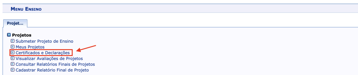
Imagem 2 - Caminho no sistema para acessar a funcionalidade de emissão de declaração ou certificado por parte do(a) servidor(a) técnico administrativo ( Módulo Ensino )