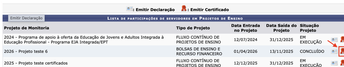
Imagem 4 - Emitir certificado de participação como membro da equipe de execução em projeto de ensino.

No caso de projeto de ensino concluído, para a emissão de certificação de participação em um determinado projeto, é necessário clicar no ícone “Emitir Certificado”, na linha do respectivo projeto, conforme indicado na Imagem 4 para o projeto intitulado “Projeto teste 6”.