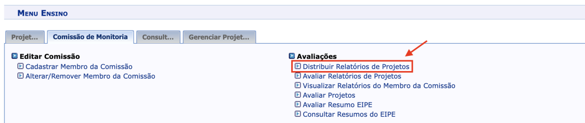
Imagem 1 - Caminho no sistema para distribuição de relatório para avaliação ( Módulo Ensino )

Módulos > Ensino > Comissão de Monitoria > Distribuir Relatórios de Projetos