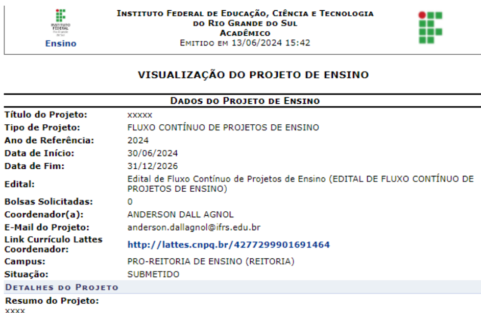
Imagem 12 - Documento de resumo de proposta emitido pelo sistema