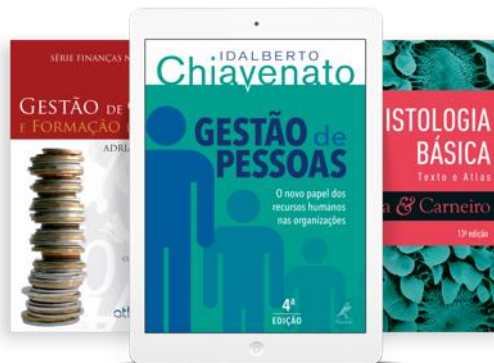
Ciências Sociais Aplicadas