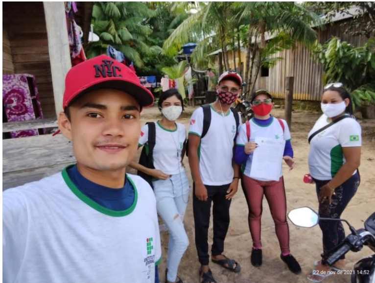
Figura 01: Estudantes e comunidade construindo o Horto Medicinal Comunitário