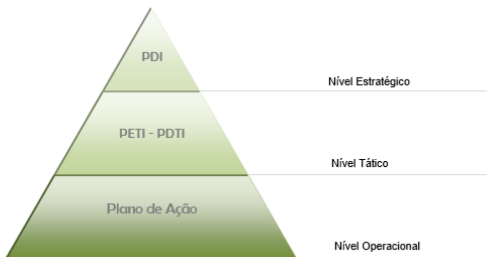
Figura 1 – Estrutura dos documentos

Esta é a quarta edição do PDTIC no IFRS e foi elaborado juntamente com o Plano de Desenvolvimento Institucional (PDI) do IFRS para o quinquênio 2019-2023. O quadro abaixo apresenta a hierarquia dos documentos de planejamento.