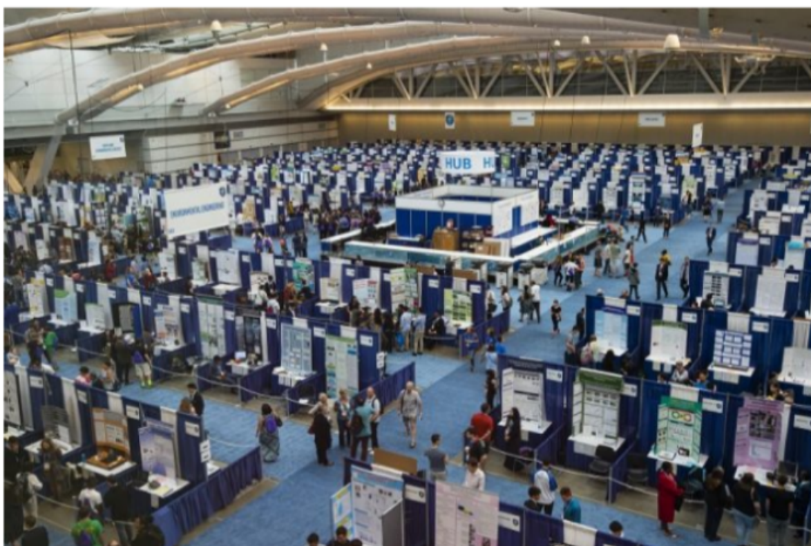
ISEF Regeneron International Science and Engineering Fair

O Instituto Federal do Rio Grande do Sul (IFRS) está representado novamente em uma das maiores feiras de ciências do mundo, a ISEF Regeneron International Science and Engineering Fair. Este ano são duas estudantes participantes, uma do Campus Bento Gonçalves e a outra do Campus Osório. A edição de 2021 é totalmente virtual e reúne mais de 1.836 jovens pesquisadores, de 65 países, regiões e territórios, com 1.480 projetos.