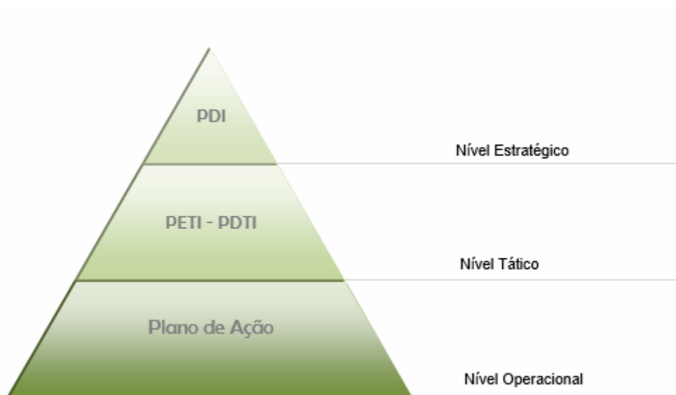
Figura 1 – Estrutura dos documentos

Esta é a quarta edição do PDTIC no IFRS e foi elaborado juntamente com o Plano de Desenvolvimento Institucional (PDI) do IFRS para o quinquênio 2019-2023. O quadro abaixo apresenta a hierarquia dos documentos de planejamento.