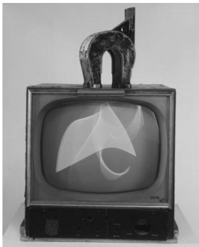
Nam June Paik, 1965.