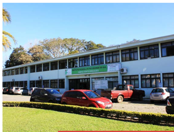
Campus Bento Gonçalves