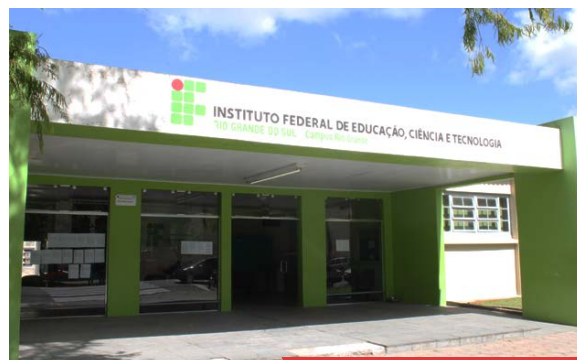
Campus Rio Grande

🕒 Horário de atendimento: De segunda a sexta-feira, das 7h às 23h.