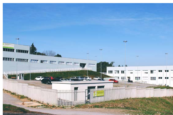
Campus Caxias do Sul