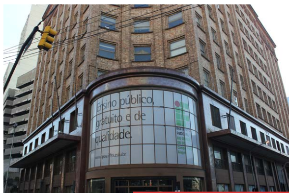
Campus Porto Alegre