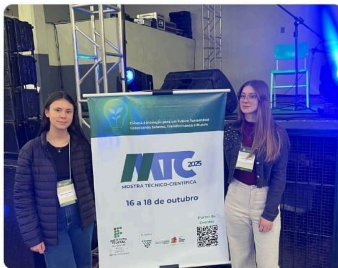
Alunas do IFRS Veranópolis participaram da Mostra Técnico-Científica 2025 , realizada no Campus Bento Gonçalves!