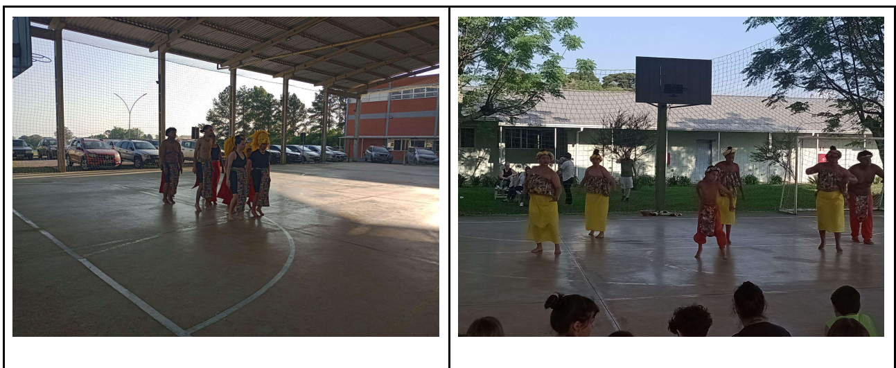
Figura 11: Apresentação de dança do grupo Afro Essência de Nova Prata