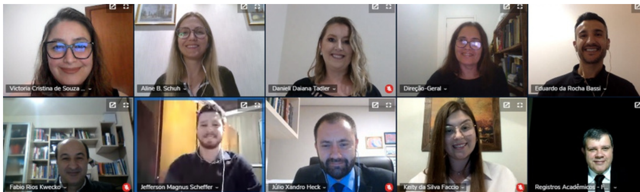
Colação de grau do Curso Superior de Tecnologia em Processos Gerenciais (TPG), realizada em formato remoto

Para todo o setor de Ensino do Campus Rolante, este ano foi de muitos desafios impostos pela pandemia da Covid-19. As aulas não pararam em 2021. Nos primeiros dias do ano, começamos o 2o ciclo das Atividades Pedagógicas Não-Presenciais (APNPs), que tiveram como objetivo a manutenção do vínculo do estudante com o IFRS. Para alunos que obtiveram êxito nessas atividades, foi possível realizar a progressão de série, minimizando os prejuízos de um 2020 praticamente perdido.