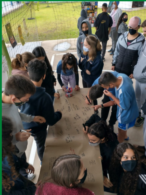
Mostra Afrocentrada na Escola Municipal de Ensino Fundamental Oldenburgo