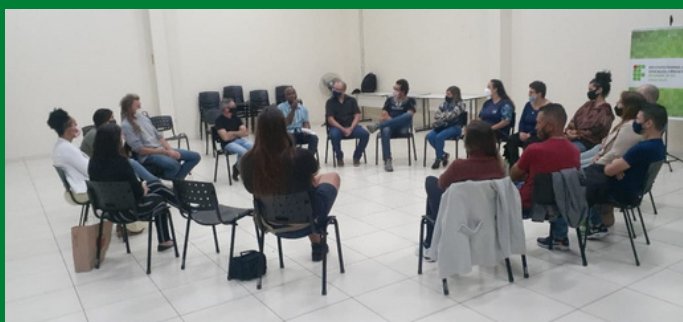
Roda de Conversa 'O que significa o Dia 20 de Novembro?'