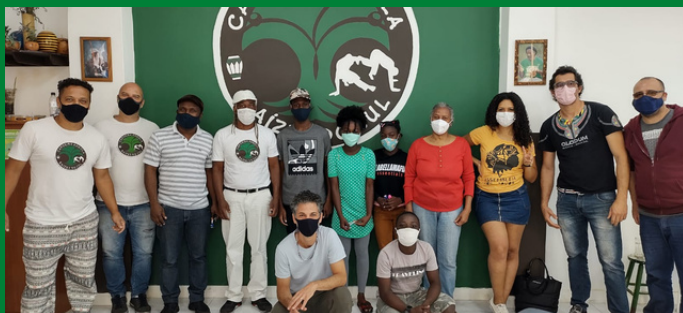
Visita na Escola de Capoeira Angola Raízes do Sul