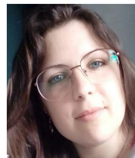
Pamela Sayão Interprete