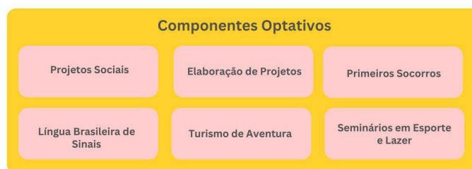
Figura 2 - Itinerário formativo do Curso Superior em Tecnologia em Gestão Desportiva e de Lazer, demonstrando sua distribuição ao longo dos semestres.