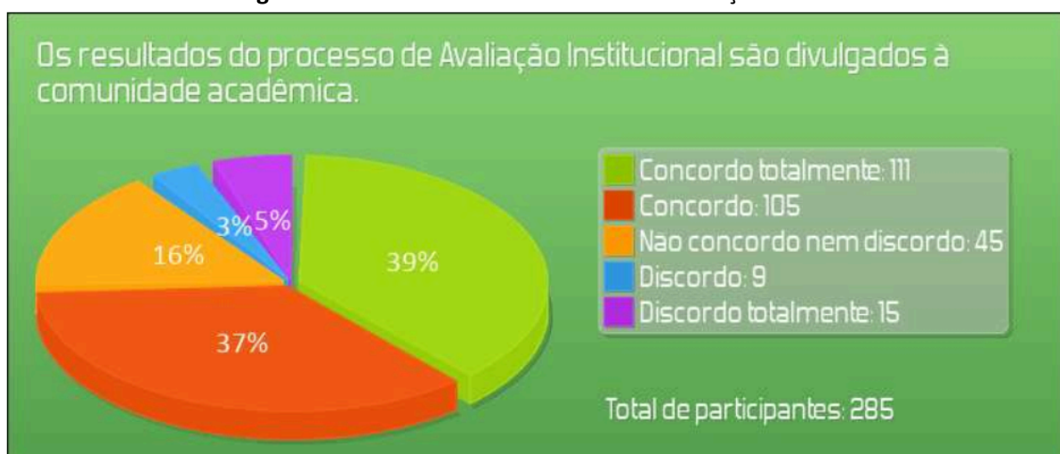
Figura 1: Indicador 1 do instrumento de Avaliação Institucional

Dentre os 285 participantes que avaliaram o item que trata da divulgação dos dados da Avaliação Institucional pela CPA, 212 avaliaram positivamente (Concordo totalmente, Concordo), como demonstra o gráfico abaixo.