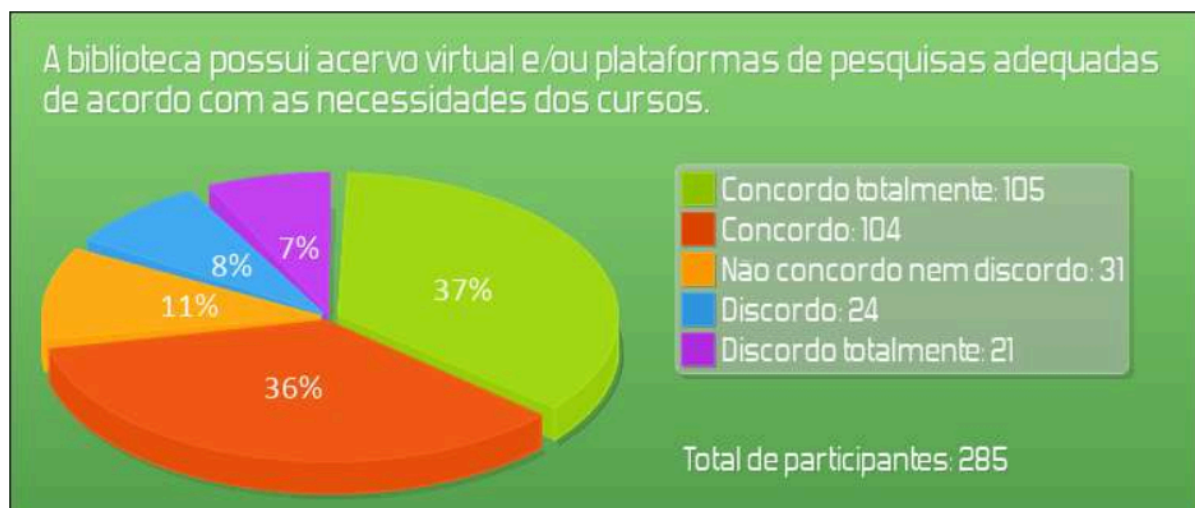
Figura 5: Indicador 16 do instrumento de Avaliação Institucional

Na avaliação de 2023, 73,3% dos participantes avaliaram como bom ou ótimo seu acervo e suas plataformas de pesquisa, como demonstra o gráfico abaixo.