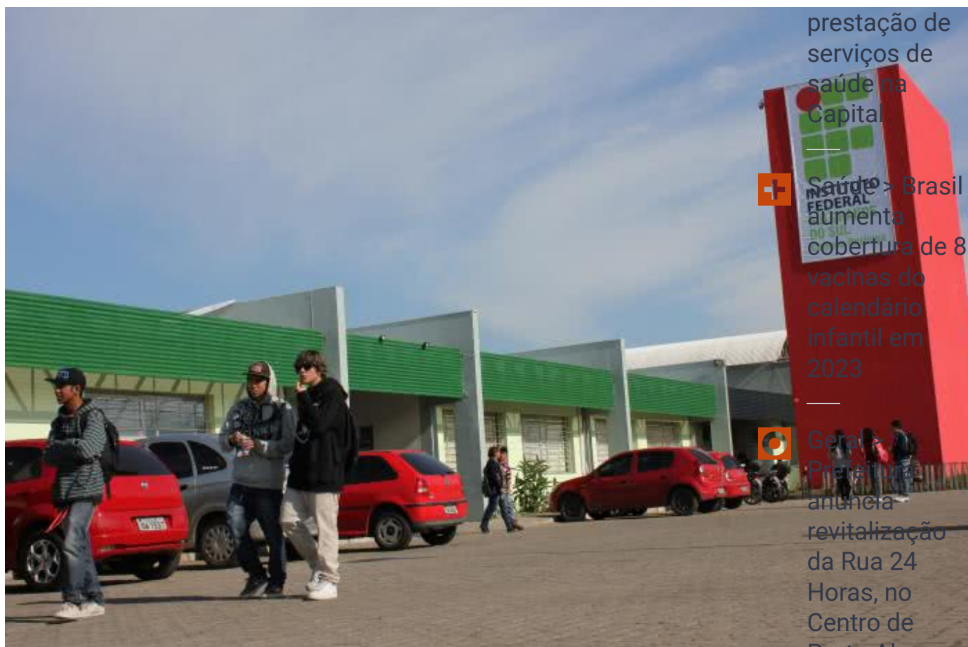
IFRS campus Restinga