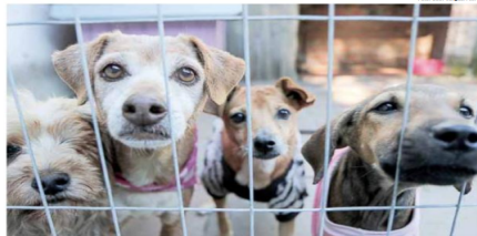
Animais Comunitários da Vila Petró recebem cuidados da Seda Local Unidade de Medicina Animal BMM

A Coordenação-Geral de Direitos Animais abrirá no dia 30 de julho o agendamento para a esterilização de cães e felinos, com previsão de encerramento às 17h do dia 1º de agosto.