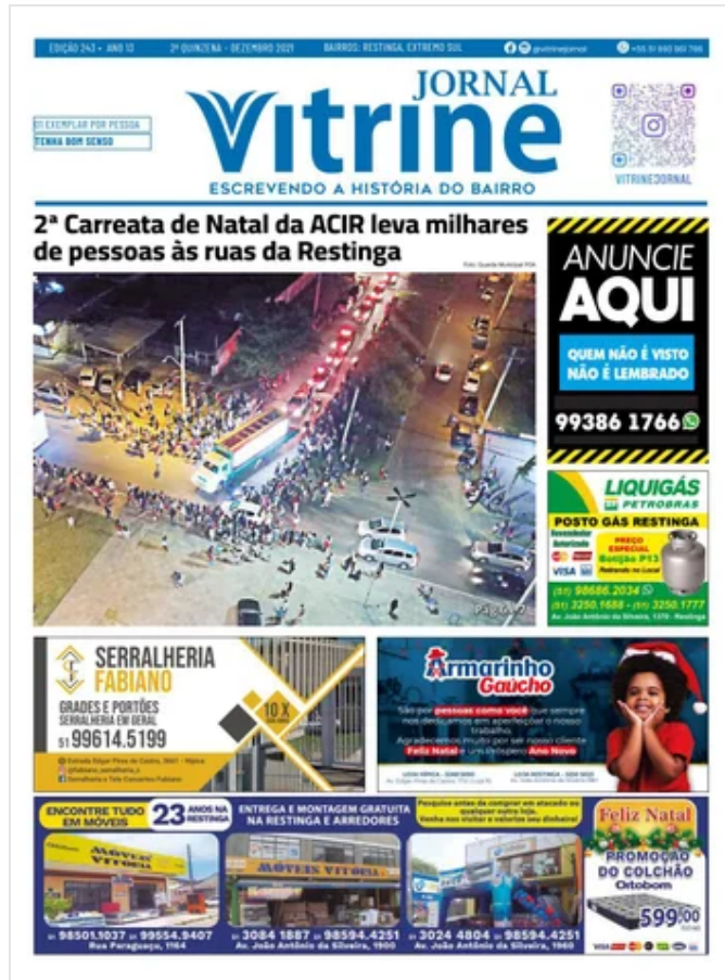
Jornal Vitrine Edição 243 December 20, 2021