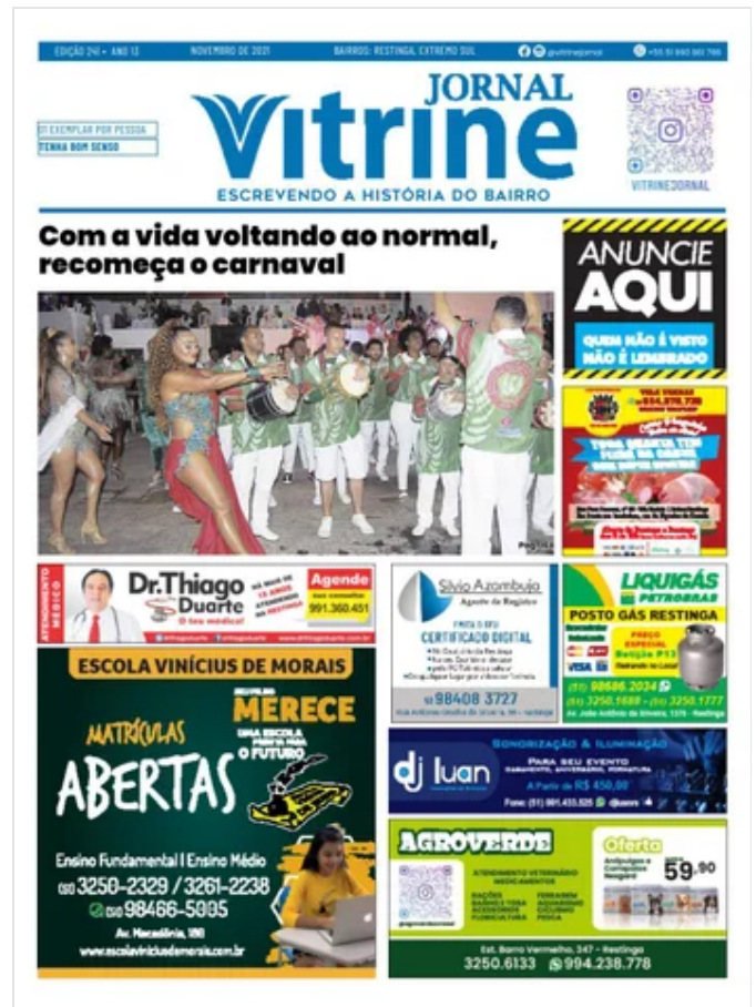
Jornal Vitrine 241