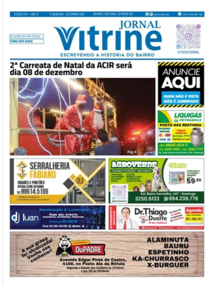
Jornal Vitrine Edição 242 December 20, 2021