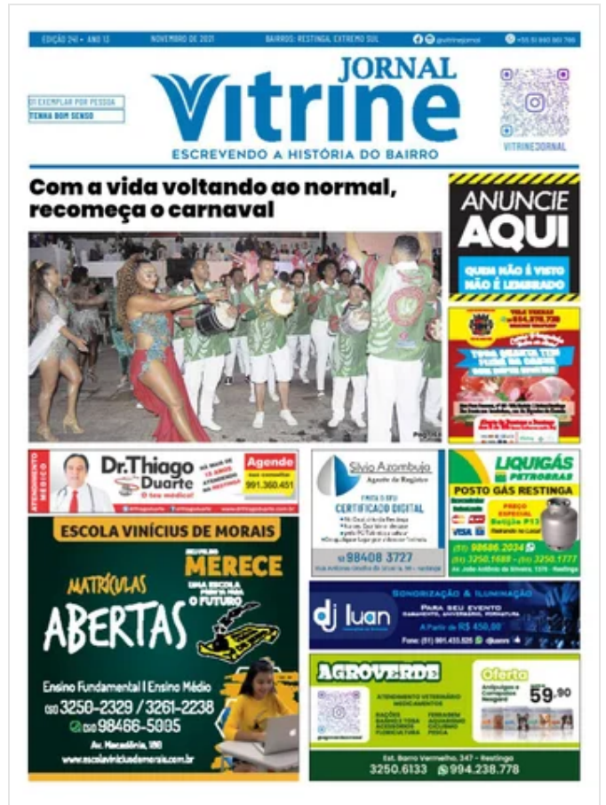
Jornal Vitrine 241