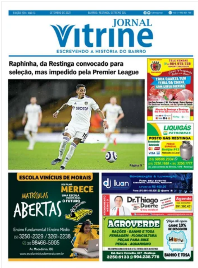
Jornal Vitrine Edição 239 December 20, 2021