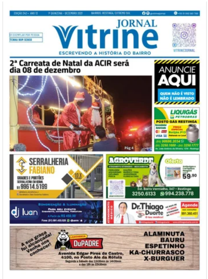
Jornal Vitrine Edição 242 December 20, 2021