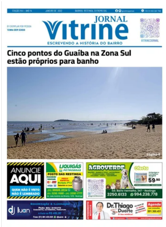
Jornal Vitrine - Edição 244 January 8, 2022