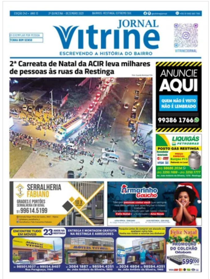
Jornal Vitrine Edição 243 December 20, 2021