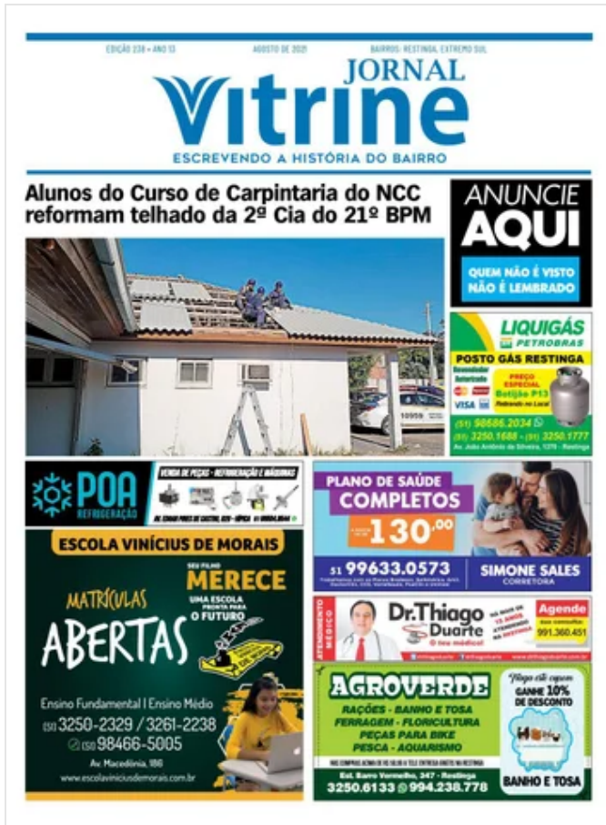
Jornal Vitrine Edição 238