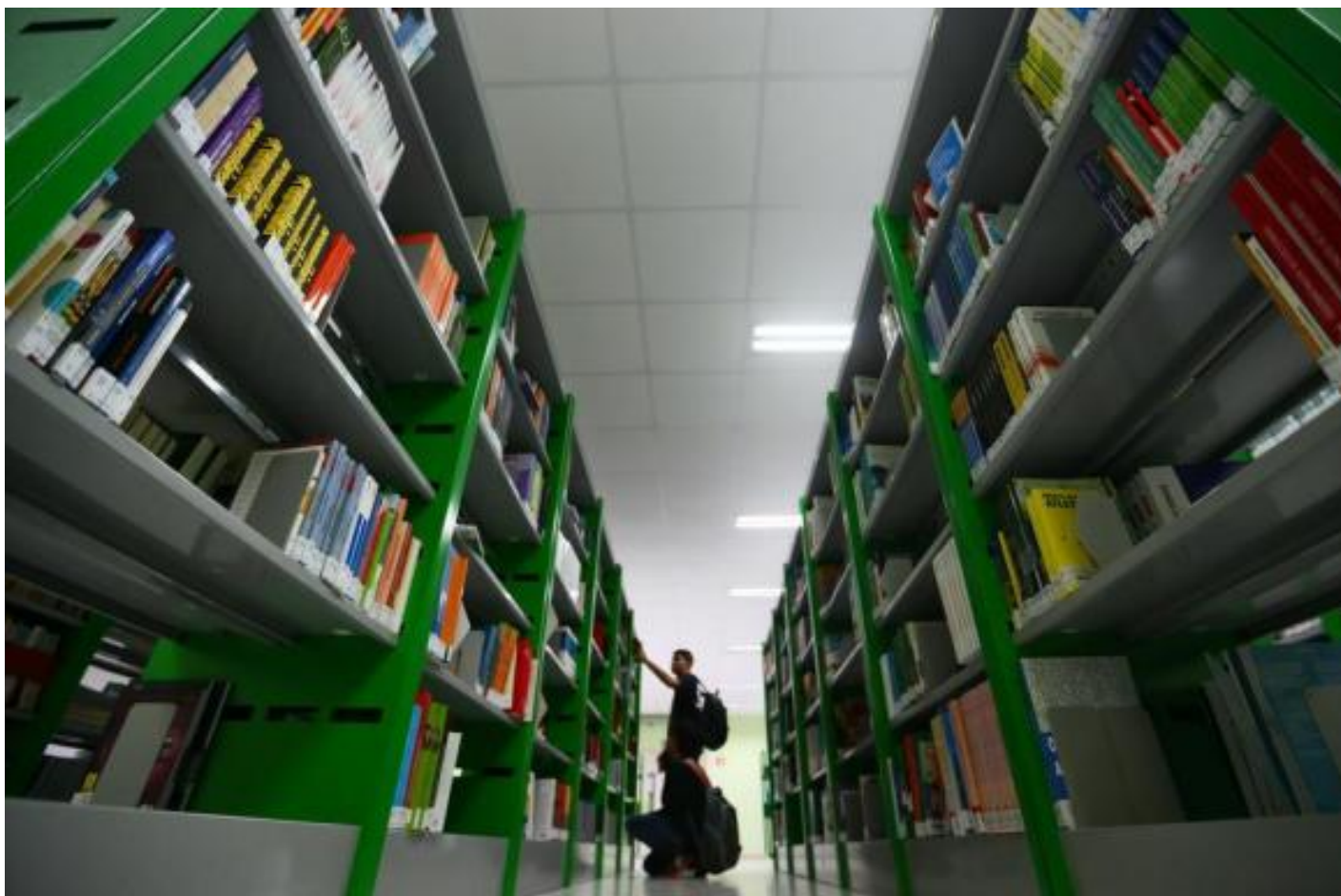
Sem livros novos na Restinga