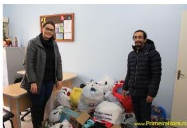
IFRS Campus Feliz

Realizada de 25 a 30 de junho, com seis atividades diárias, a 1ª Gincana IFRS do campus Feliz teve como objetivo principal promover a solidariedade e a integração entre os alunos e as turmas. Foi uma semana intensa, onde os estudantes tiveram tarefas que tiveram que ser entregues em 24 horas. Muitas delas envolveram, inclusive, os pais dos alunos. A equipe campeã foi a do 1º ano B do curso Técnico em Informática, que iniciou há pouco tempo os estudos no Instituto.