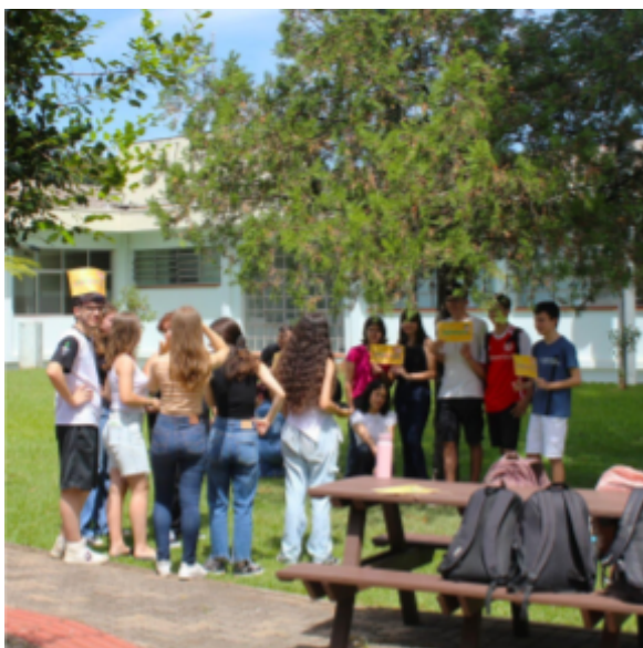
Imagem 5: Recepção aos Estudantes