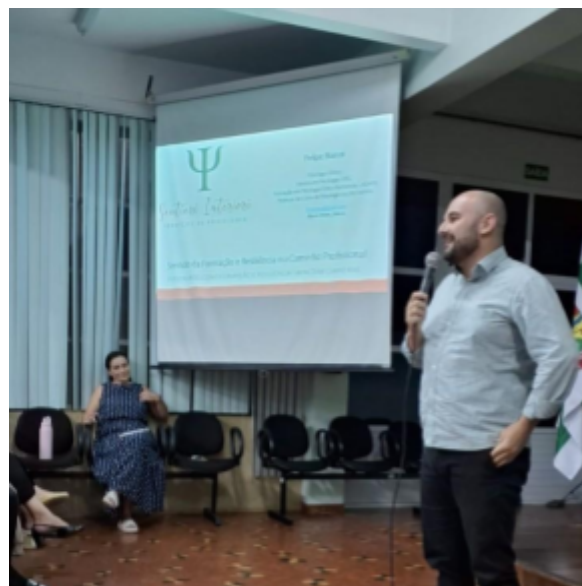
Imagem 8: Recepção aos Estudantes dos cursos Superiores e Subsequentes: Palestra