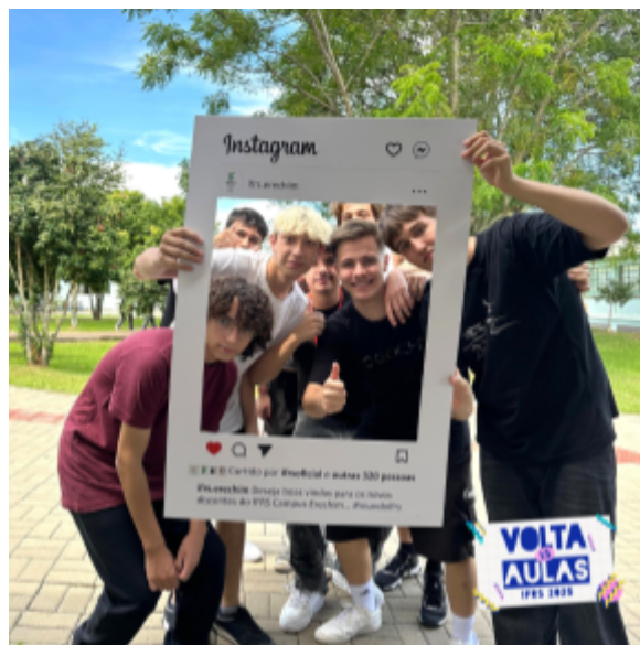
Imagem 6: Recepção aos Estudantes