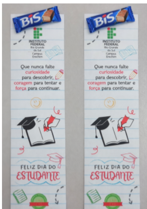
Imagem 9: Dia do Estudante - Marca Página e Bis

No dia do estudante, a CAE criou e entregou um marca página com um chocolate Bis para os estudantes do Ensino Médio Integrado, Subsequente e Superior.