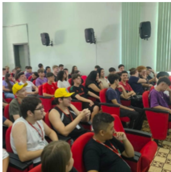
Imagem 4: Recepção aos Estudantes