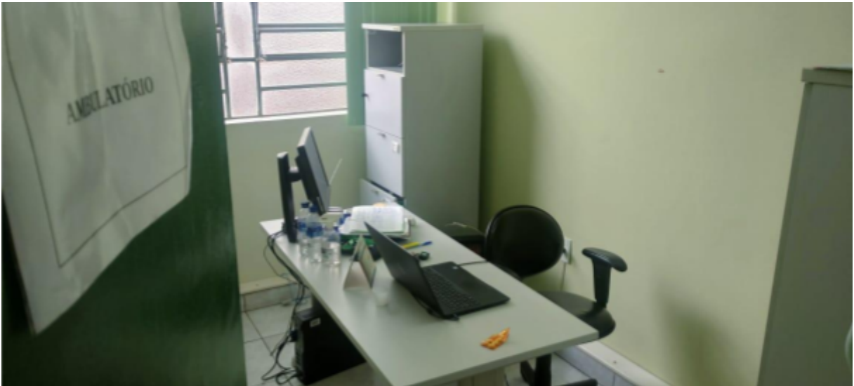
Imagem 15: Ambulatório

Já no Bloco 4, fica localizado o ambulatório, no qual uma enfermeira está à disposição para atendimento aos estudantes.