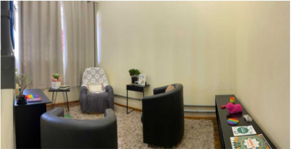
Imagem 11: Sala de Atendimento Psicológico e de Regulação