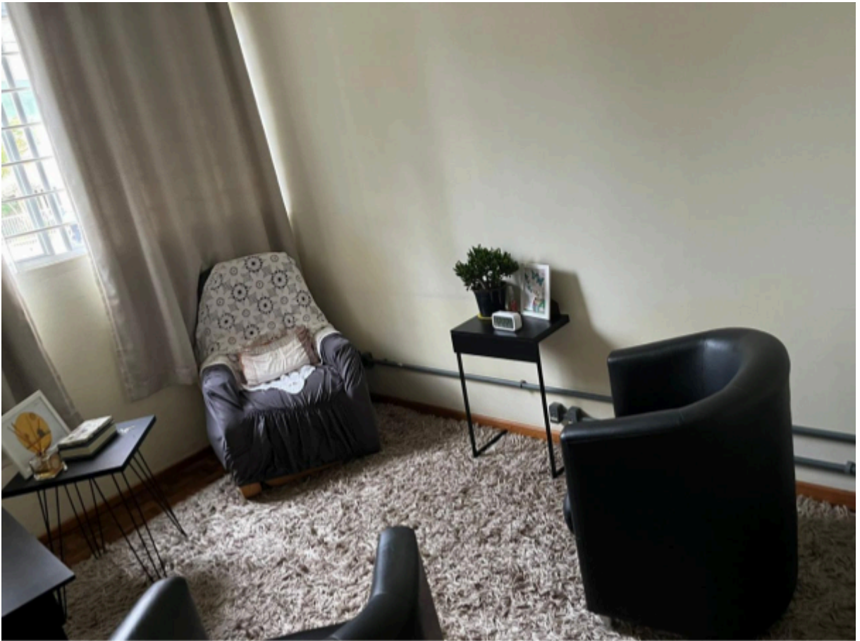
Imagem 13: Sala de Atendimento Psicológico e de Regulação