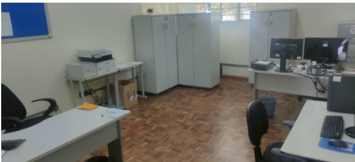
Imagem 10 - Sala da Coordenação de Assistência Estudantil e Assistente de Alunos

No Bloco 1, em 2 salas estão lotados os profissionais de Psicologia, Pedagogia, Assistente Social e Assistente de Alunos, assim como a Coordenação de Assistência Estudantil.