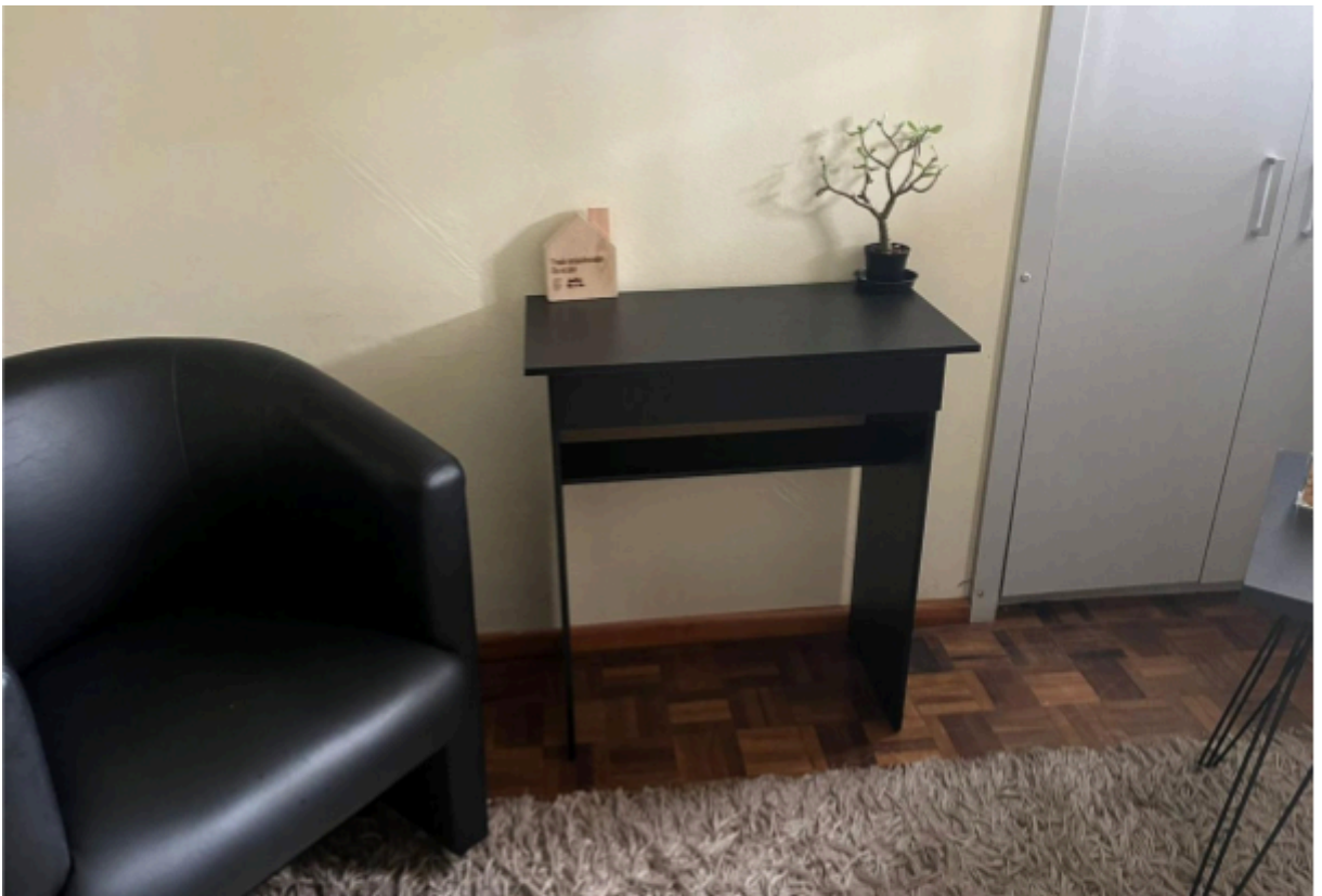
Imagem 14: Mobília da Sala de Atendimento Psicológico e de Regulação