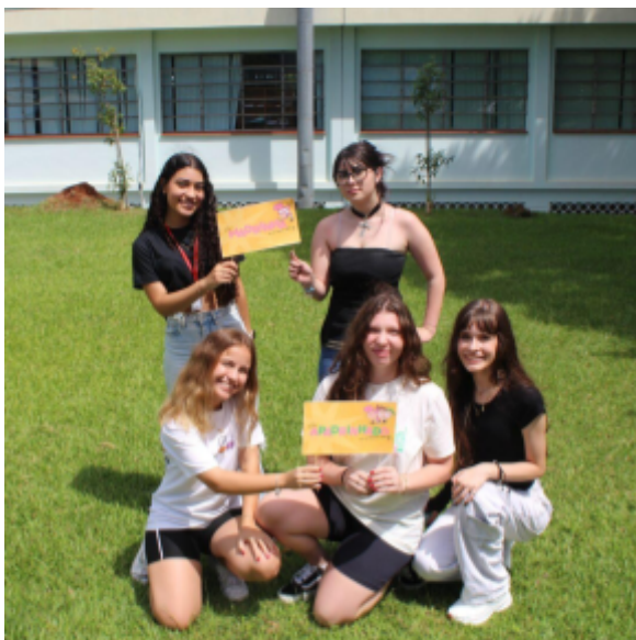
Imagem 3: Recepção aos Estudantes

No período da manhã, com os estudantes do Ensino Médio Integrado, a recepção iniciou-se em sala de aula para os primeiros anos, e logo após, eles foram conduzidos ao auditório, onde foi realizada a apresentação da equipe de servidores do IFRS Campus Erechim, orientações e funcionamento da instituição. Logo após, os estudantes participaram de um tour pelo campus e posteriormente recepcionados na quadra de esportes pelas turmas de 2º e 3º anos.