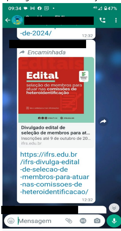
Figura 2 – Reprodução de postagem sobre edital de seleção de membros da comissão de heteroidentificação em grupo de Whatsapp