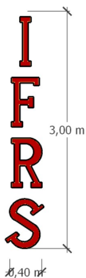
Figura 1: Modelo de letreiro

*O letreiro deverá ser aprovado pelo Departamento de Comunicação do IFRS, antes de sua confecção, respeitando os padrões de uso da marca da Instituição.