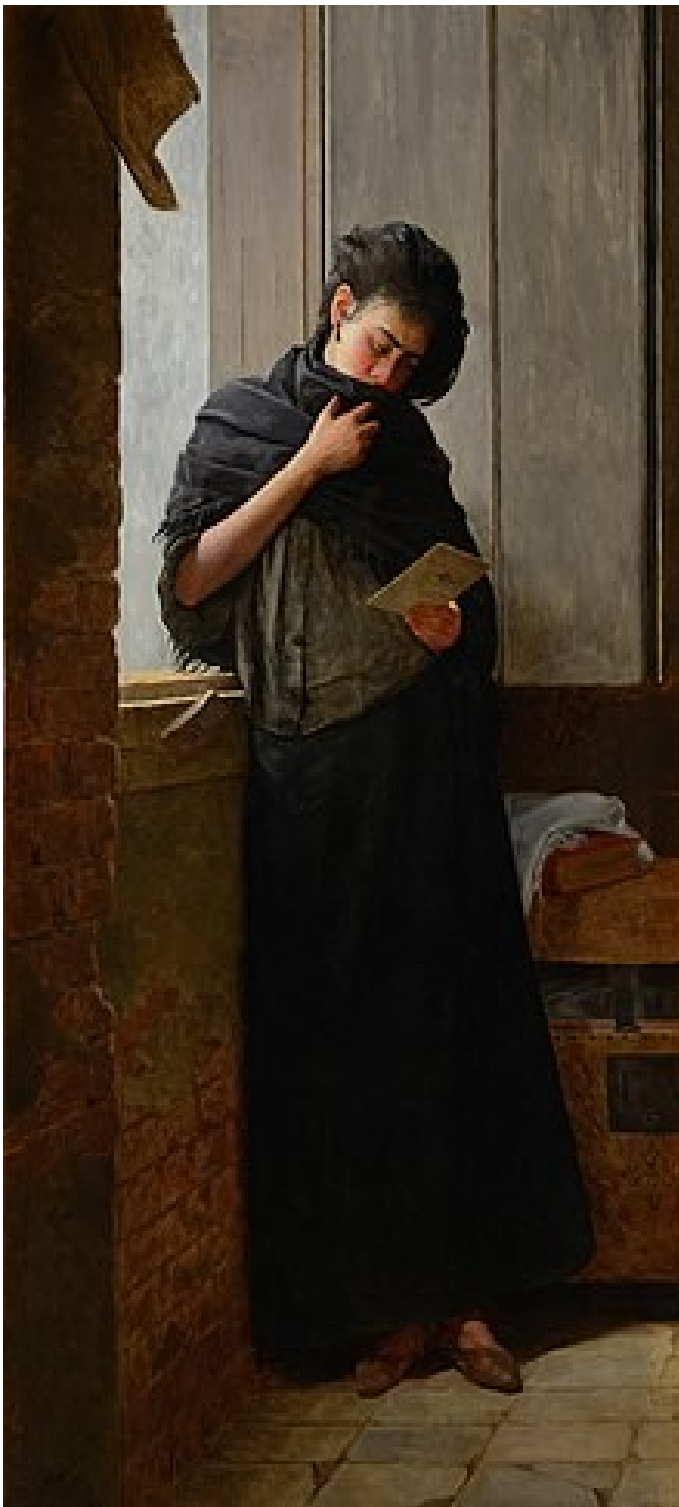
Saudade. Almeida Júnior, 1899.

É UMA PALAVRA QUE NÃO TEM TRADUÇÃO LITERAL EM MUITAS LÍNGUAS.