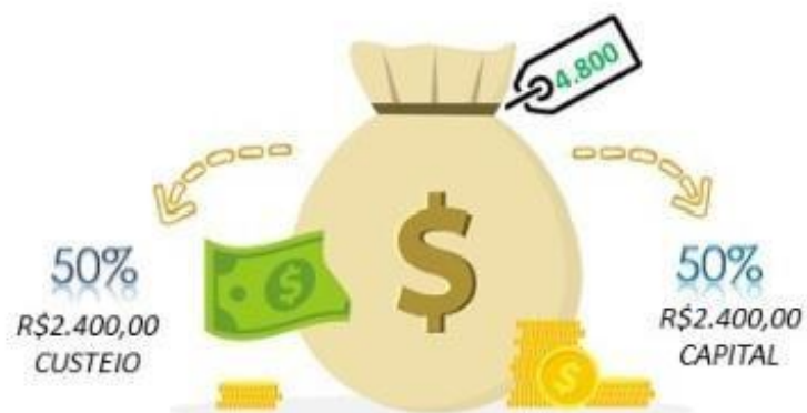
Figura 1. Demonstração de possibilidades de aplicação do AIPCT (custeio e capital)

O valor do auxílio solicitado é de R$ 4.800,00. O valor máximo a ser destinado para despesas de CAPITAL é de R$2.400,00.