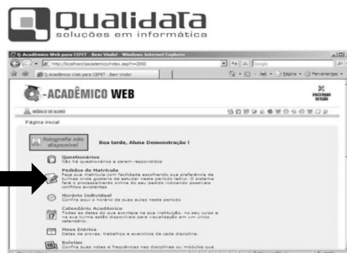
Figura 1 - Tela inicial do Q-Acadêmico exibindo a opção 'Pedido de Matrícula'

Nas datas específicas, o estudante deverá acessar a página do campus Bento: [http://www.bento.ifrs.edu.br], menu [Sistemas/ Sistema Acadêmico]. Digitar o login (número da matrícula) e senha . A opção Pedidos de Matrícula estará ativa somente nas datas correspondentes, especificadas no item 4.