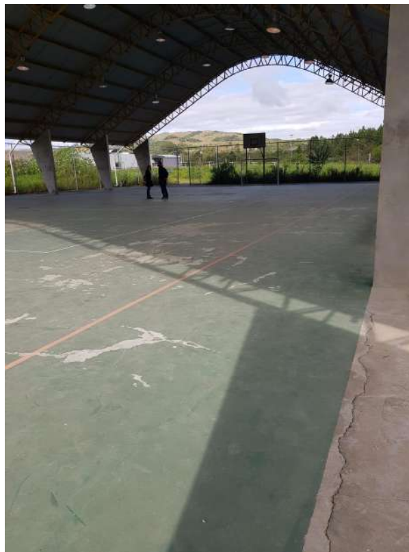
Piso existente na quadra