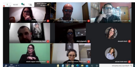
Prints da reunião com os pais, mães e/ou responsáveis.